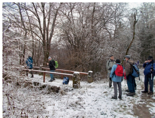
09.12.2017 - Zum Weihnachtsmarkt n. Altdorf