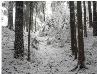
06.01.2018 - Winteridylle Aurachtal - Seebachgrund