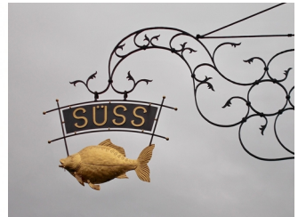
27.12.2017 - Zum Crailsheimer Wasserschloss