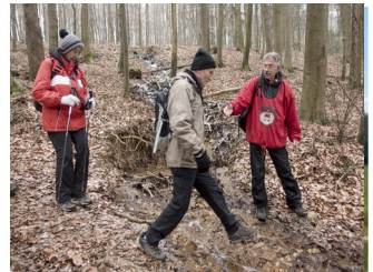
20.01.2018 - Amberger Luft in allen Variationen