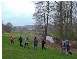
10.02.2018 - Eismannsberg -Traunfelder Bach