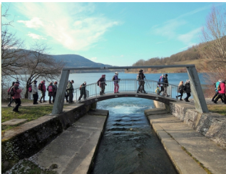
17.02.2018 - Durch das Haselbachtal