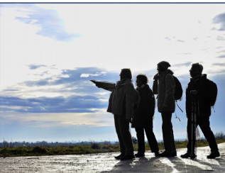
16.12.2017 - Weihnachts- markt Rothenburg