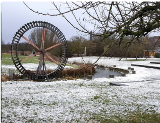
20.01.2018 - Vorwanderung Sippelmühle